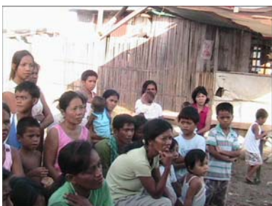
Enseignement de la MOB à Manille