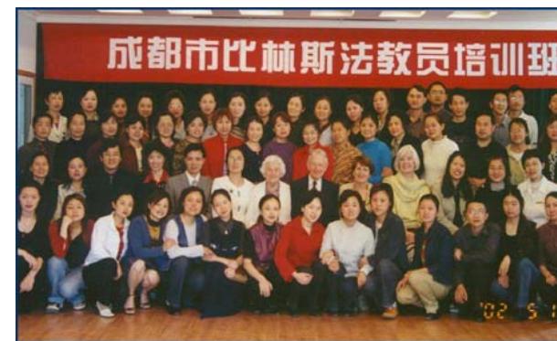
Groupe enseigné par les Drs Billings en Chine

A travers le monde, là où par l'enseignement de la Méthode de l'Ovulation Billings se transmet aussi une manière fiable de résister