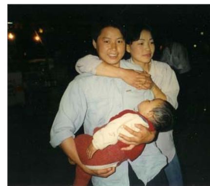
Femme chinoise ayant conçu grâce à la MOB