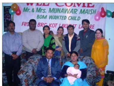
Enseignants de la MOB au Pakistan