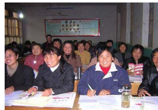
Classe MOB en Chine